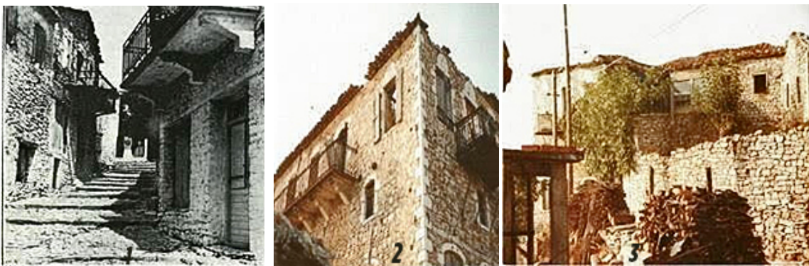
Φωτογραφίες όψεων πετρόχτιστων αρχοντικών κτιρίων