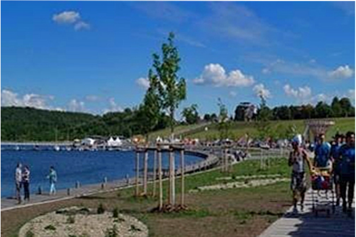
Φωτο. όπως παρουσιάστηκε περιγραφικά στην εφημερίδα « ΝΕΑ ΤΗΣ ΜΕΓΑΛΟΠΟΛΕΩΣ »